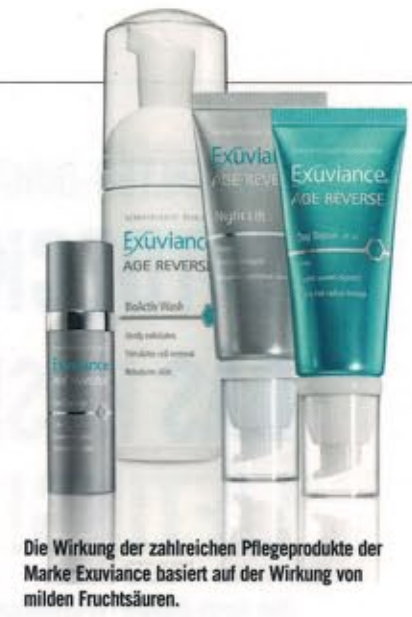
Die Wirkung der zahlreichen Pflegeprodukte der Marke Exuviance basiert auf der Wirkung von milden Fruchtsäuren.

Topskin Cosmetics GmbH Kohlmarkt 5, Belle Etage 1010 Wien Tel. 01/532 62 72 office@topskin.at www.topskin.at