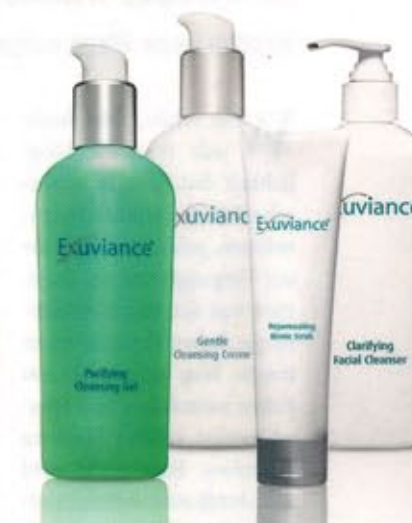
Nach nur zwei- bis sechswöchiger, regelmäßiger Anwendung von Exuviance-Kosmetikprodukten können Sie eine Hautverbesserung erwarten.